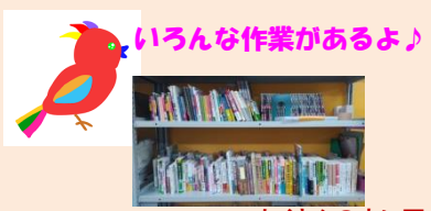
いろいろな作業があるよ♪